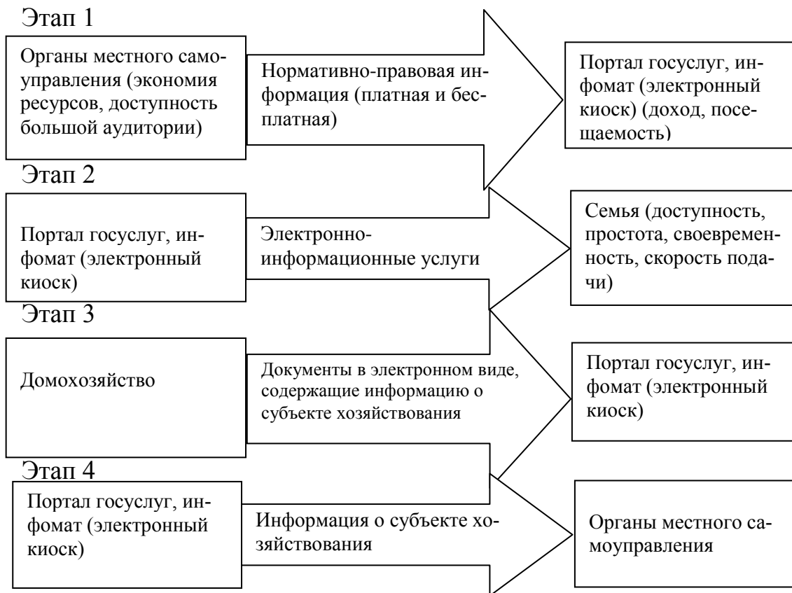
Рис. 2. Четыре этапа технологического процесса оказания электронных информационных услуг органами местного самоуправления

На третьем – для субъекта «домохозяйство» - затраты времени на заполнение нужных электронных таблиц, являющихся сущностью электронных документов, а для «портала госуслуг» - время на получение объективной информации о субъекте «домохозяйство».