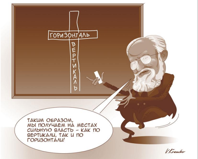
Карикатура художника Владимира Кремлева www.espresso-id.ru/obshestvo/2616.html

ГАЗЕТА О МЕСТНОМ САМОУПРАВЛЕНИИ В РОССИИ