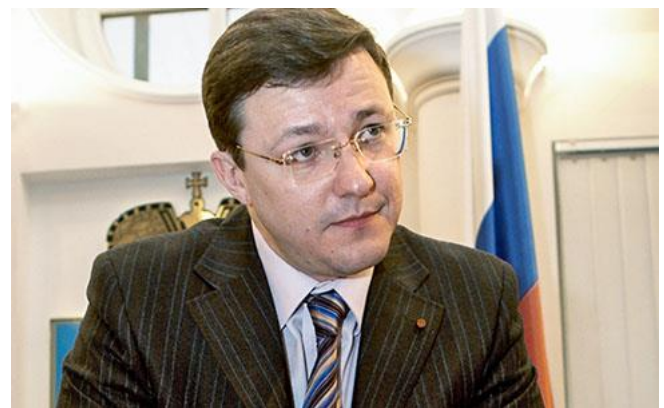
Бывший мэр Самары Дмитрий Азаров