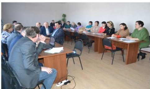
Обучающий семинар для предпринимателей по работе в ФГИС «Меркурий»

- организация деятельности Районного Совета по развитию малого и среднего предпринимательства; информационная поддержка.